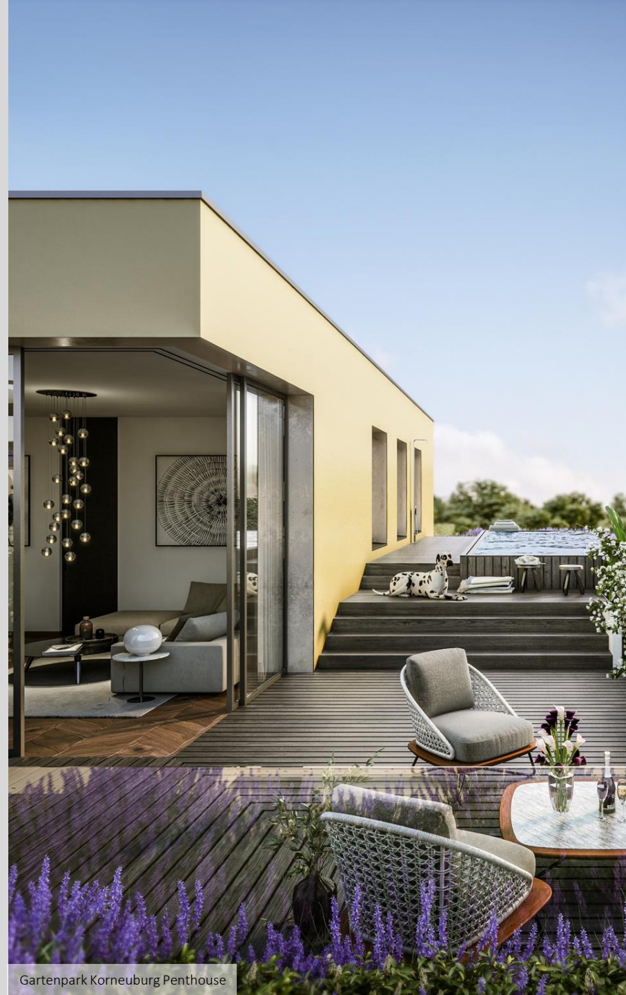
Gartenpark Korneuburg Penthouse

Hierbei werden die gesamte Wertschöpfungskette Grundstücksakquisition – Projektstrategie – Planung – Bau – Projektsteuerung – Verwertung – Verwaltung und Betreuung sowie alle Supportprozesse innerhalb der Gruppe abgedeckt. Die einzelnen Unternehmen der Wiener Komfortwohnungen Gruppe treten jeweils als (Teil)-GU zu marktüblichen Preisen auf.